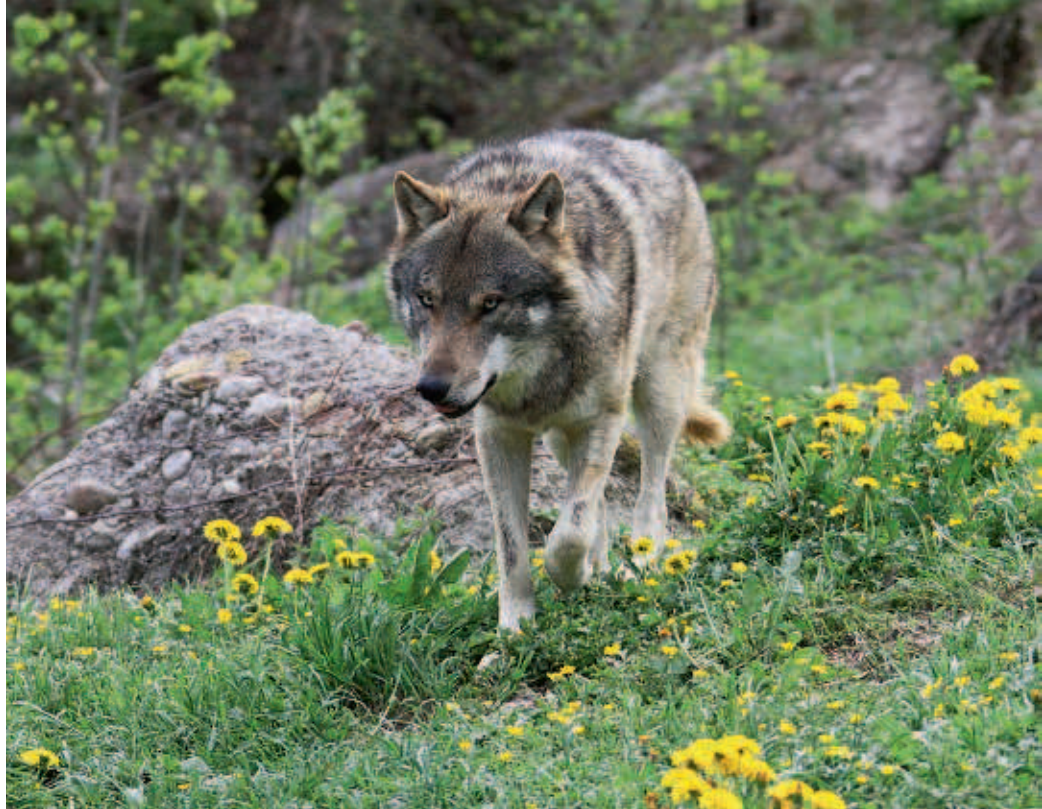
Eine Begegnung mit einem frei lebenden Wolf ist sehr selten.

Ein erfolgreicher Schutz ist aber auch immer abhängig von den betrieblichen, topographischen, ökologischen und sozioökonomischen Faktoren. Bei sehr steilen und topographisch schwierigen Alpen ist der Einsatz von Zäunen nicht überall möglich. Je nach Gelände, Grösse der Alp und Anzahl der Tiere muss beurteilt werden, welche Herdenschutzmassnahmen für diese Alp am besten sind. Die Umsetzung des optimalen Herdenschutzes ist für den Alpbewirtschafter immer mit einem finanziellen und vor allem auch grossen zeitlichen Mehraufwand verbunden.