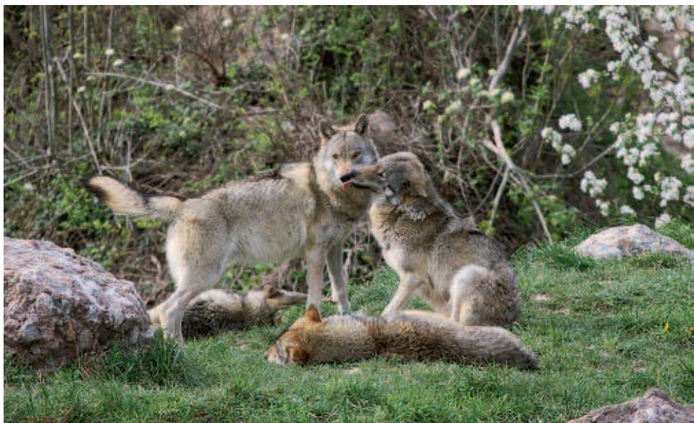
Wolfsrudel im Tierpark Goldau.

Durch die Rückkehr des Wolfes und dessen natürliche Regulierung des Wildbestandes verändert sich auch das Verhalten der Hirsche und Rehe. Sie wandern mehr umher, wodurch die Vegetation Zeit hat, um sich zu regenerieren. Auch können sich die Schutzwälder dadurch besser verjüngen. Auf diese Weise werden Erosion und damit Erdrutsche, Lawinen