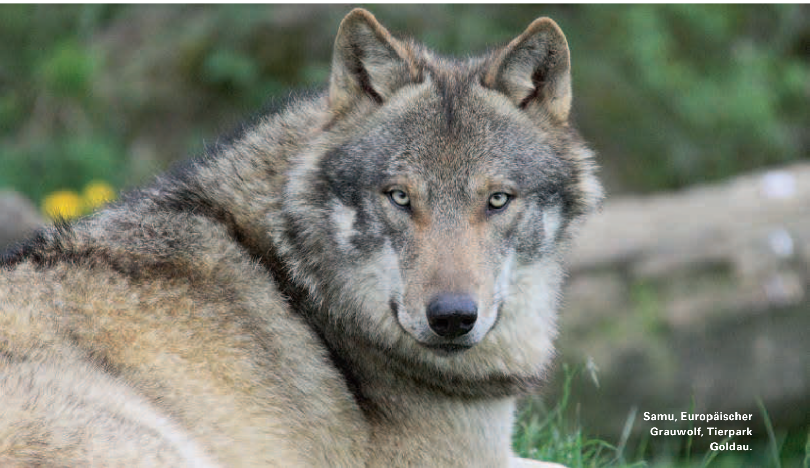
Samu, Europäischer Grauwolf, Tierpark Goldau.

Im Märchen wird der Wolf meist als Menschenfresser und Bösewicht dargestellt. Das Märchen der Gebrüder Grimm «Das Rotkäppchen» hat dieses Bild für Generationen von Kindern geprägt. Viele haben Angst vor dem Wolf – ein Raubtier – eine Gefahr für uns Menschen. Doch ist der Wolf wirklich so böse? Brauchen wir uns vor ihm zu fürchten? Ein Märchen – oder einfach Unwissenheit. Kennen wir den Wolf wirklich? Oder schrecken uns die Meldungen – der Wolf hat wieder ein Schaf gerissen – das könnte auch uns passieren, einfach ab?