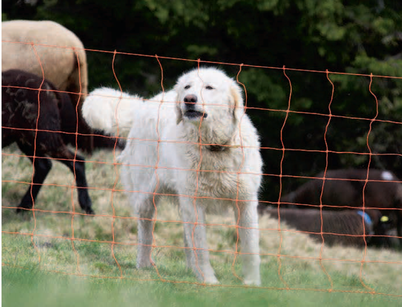
Elektrozaun und Herdenschutzhund – eine optimale Sicherheit für die Nutztiere.