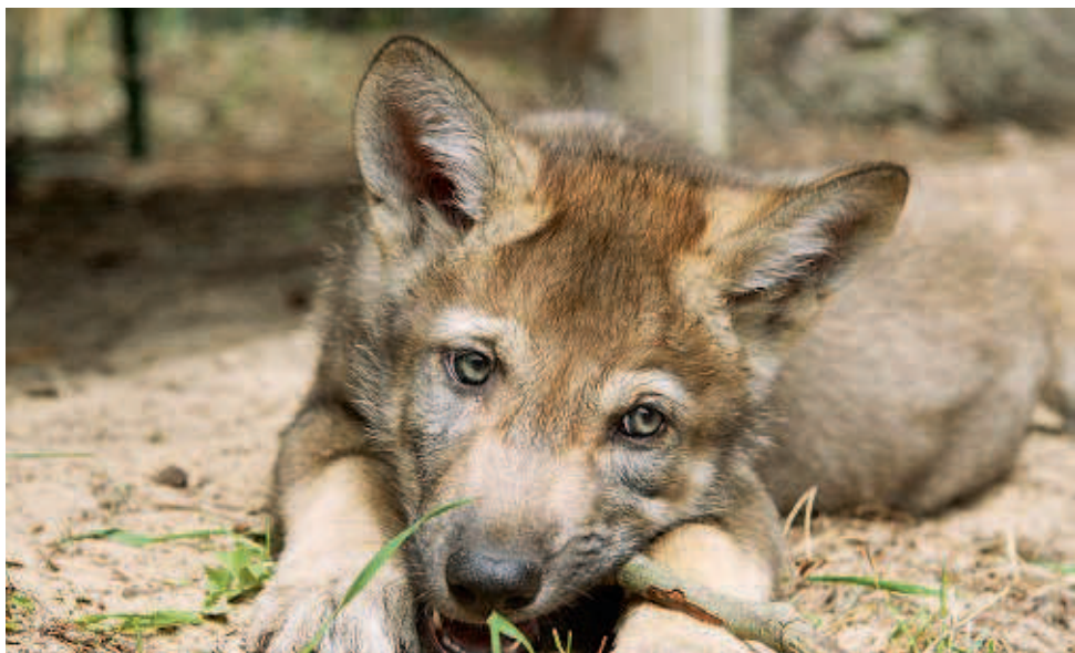
Wolfswelpen Runa, 7 Wochen alt, im Wildpark Schorfheide (D).