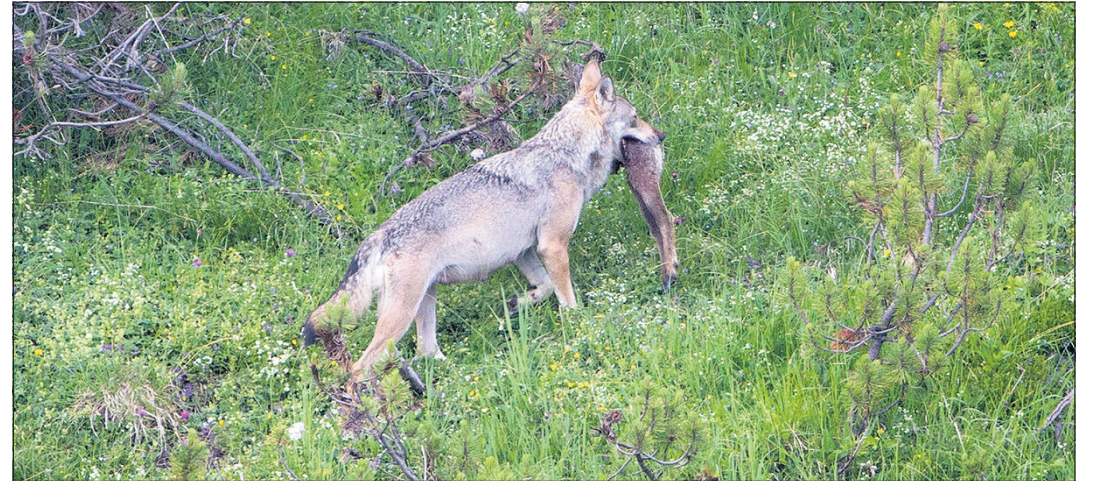
Mutter des Calanda-Rudels.

Das alles ist normales Wolfsverhalten und hat nichts mit verlorener Scheu zu tun!