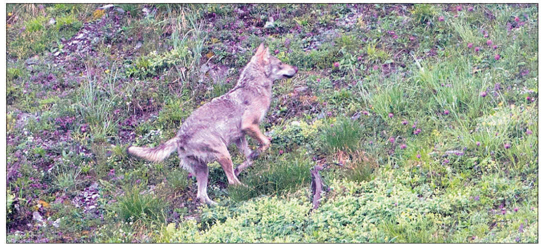
Jungwolf des Calanda-Rudels.