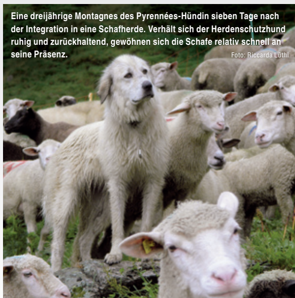
Eine dreijährige Montagnes des Pyrénées-Hündin sieben Tage nach der Integration in eine Schafherde. Verhält sich der Herdenschutzhund ruhig und zurückhaltend, gewöhnen sich die Schafe relativ schnell an seine Präsenz.

ihrem ursprünglichen Aufgabengebiet und den dazugehörigen rauen Lebensbedingungen sind Herdenschutzhunde äusserst witterungsunempfindlich. Der Schutztrieb und das starke Territorialverhalten gehören zu ihren herausragenden Eigenschaften. Ihre Arbeit erledigen sie weitgehend selbständig. Grundsätzlich wird alles Fremde innerhalb ihres Territoriums misstrauisch betrachtet und beim geringsten Anflug einer Gefahr verjagt. Ist die Herde ruhig, legen Herdenschutzhunde für gewöhnlich eine stoische Gelassenheit an den Tag, und eine Gleichgültigkeit gegenüber unbedeutenden Reizen. Jedoch kann der vermeintlich dösende Hund sich in Sekundenschnelle zu einem imposanten, reaktionsschnell abwehrenden Schutzhund verwandeln. Der sparsame und sinnvolle Einsatz seiner Kräfte ist massgebend für den effektiven Schutz seiner anvertrauten Herde. Der gut geführte Herdenschutzhund beobachtet den Eindringling – Wanderer, Biker – aus sicherer