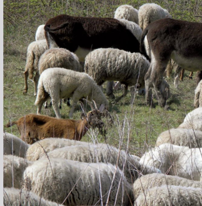
1000-köpfige Schafherde mit Eseln, Ziegen und sechs Schutzhunden in Norditalien. Auch in Norditalien musste die Arbeit mit den Schutzhunden wieder neu gelernt werden, denn auch hier sind die Wölfe erst Anfang der 90er-Jahre wieder zurückgekehrt.