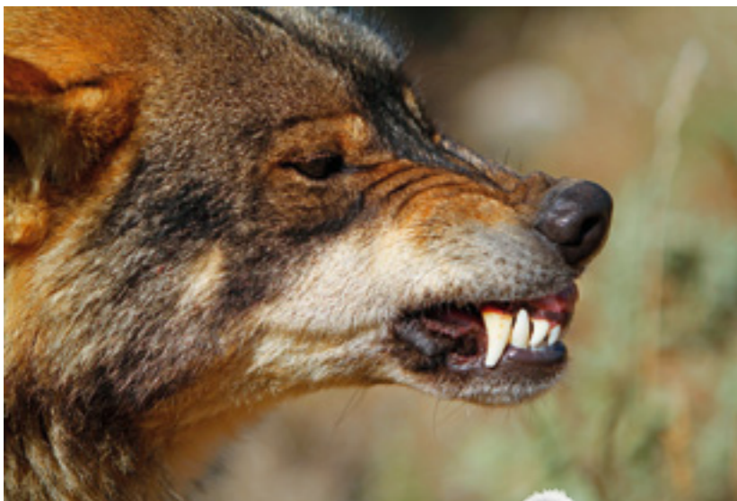
Der Wolf hat 42 Zähne. Er frisst nicht nur frisch gejagtes Fleisch, sondern auch Aas.

wenige hundert Meter vom Stadtrand entfernt, in eine Fotofalle. Diesmal schrieb sogar die deutsche Presse über ihn.