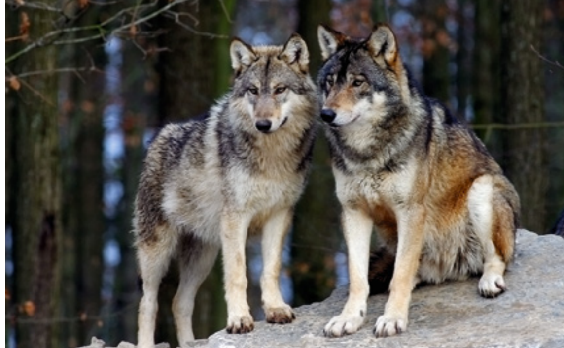
Wenn Wolf und Wölfin sich gefunden haben, bleiben sie zusammen.