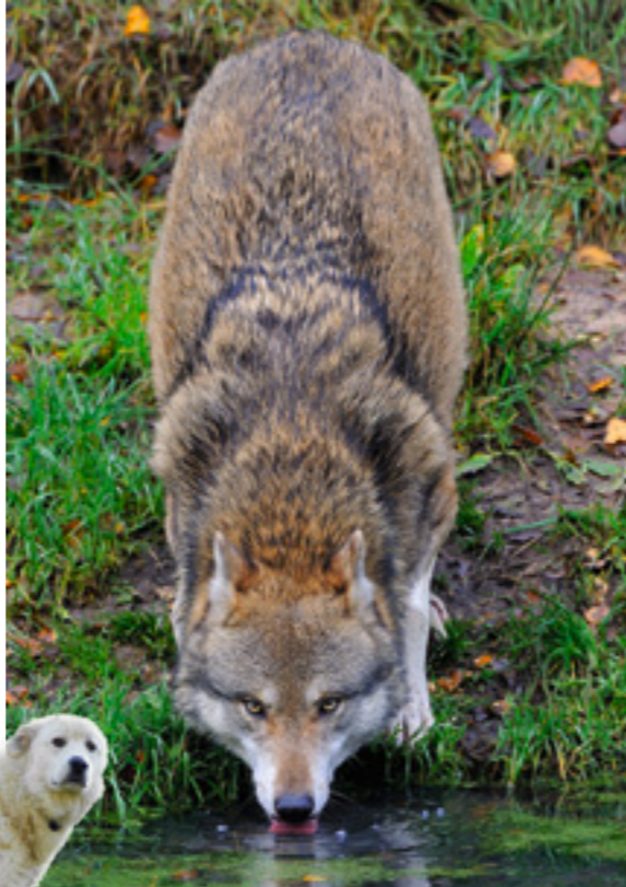
Auch beim Trinken ist er wachsam.

Viel eher als auf einen Wolf trifft man in den Bergen auf Herdenschutz-hunde. Nicht streicheln, nicht herum-fuchteln und die Hunde ignorieren, auch wenn sie einem folgen, lauten die Benimmregeln. Aber was tun, wenn man einem Wolf begegnet? «Den Augenblick geniessen, denn er ist vermutlich einmalig», sagt Reinhard Schnidrig vom Bundesamt für Umwelt. In den letzten Jahrzehnten fand in Europa kein Wolfsangriff auf Menschen statt. Mehr Informationen auf www.herdenschutzschweiz.ch