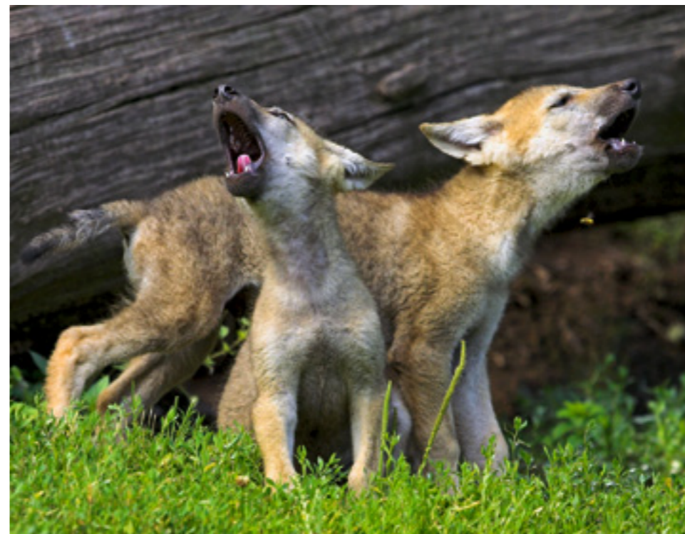
Die wenigen Monate alten Welpen bleiben noch mindestens ein Jahr bei den Eltern.

Binnen zwei Wochen tötete M20 knapp 30 Schafe. Der Herdenschutzbeauftragte des Bundes beging die betroffenen