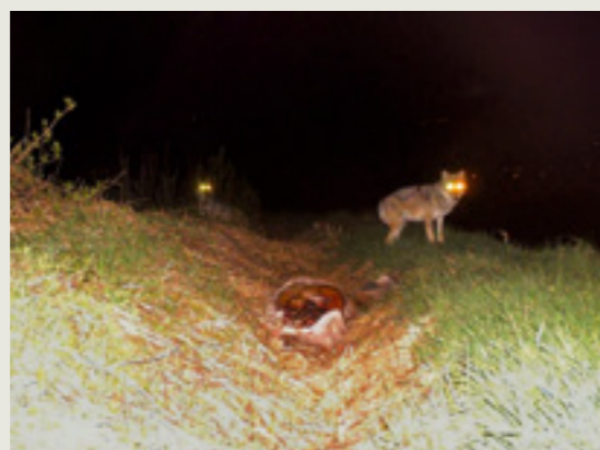
Das Territorium der ersten Schweizer Wolfsfamilie befindet sich im Calanda-Massiv (l. o.). Das einzige Bild, auf dem M30 und F7 zusammen zu sehen sind, zeigt sie bei einer erlegten Hirschkuh (r. o.). Links: Der Wildhüter Claudio Spadin überprüft eine Fotofalle.