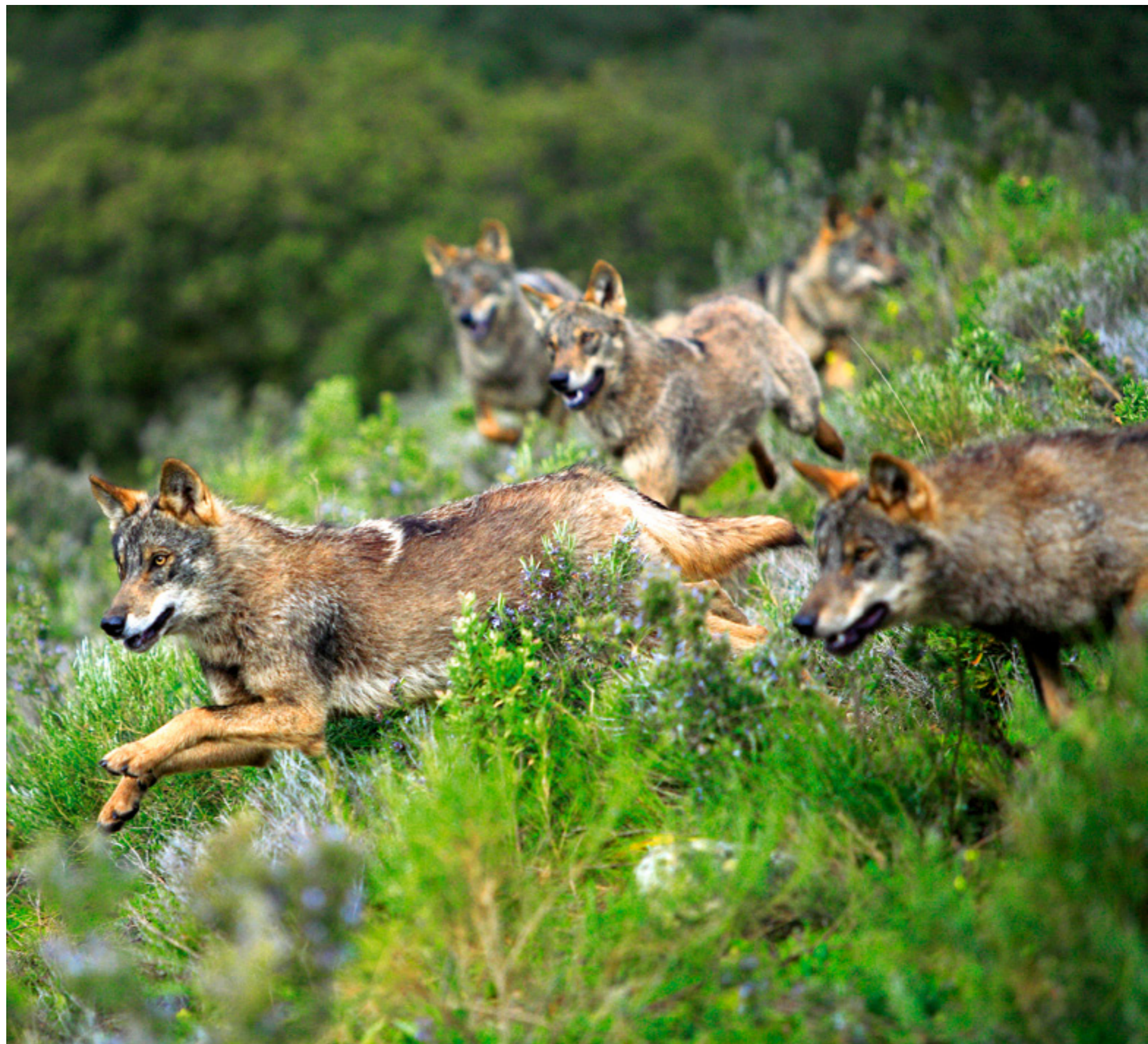
Eine europäische Wolfsfamilie umfasst drei bis elf Tiere. Im Alter von ein bis zwei Jahren verlassen die Jungen die Eltern.