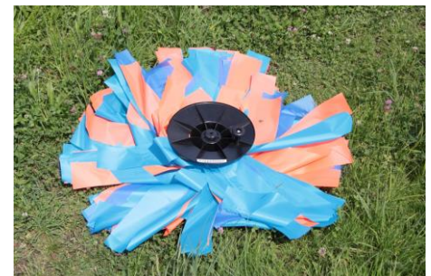
Lappenzaun auf Haspel