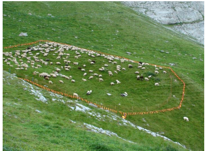
Nachtpferch zusätzlich mit Lappenzaun gesichert

Die leichten, farbigen Stofflappen flattern im Wind und bilden so ein sich ständig bewegendes optisches Hindernis. Die Farben Orange und Blau bilden zur meist grün dominierten Umgebungsfarbe einen guten Kontrast und die Farbe Blau liegt im maximalen Empfindlichkeitsbereich der Farbwahrnehmung der Wölfe.