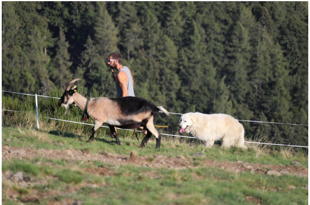
Murdock darf mit zur Abend-/Nachtweide

Wir wünschen den Alpbewirtschaftern und den Tieren einen ruhigen und erfolgreichen Herbst!