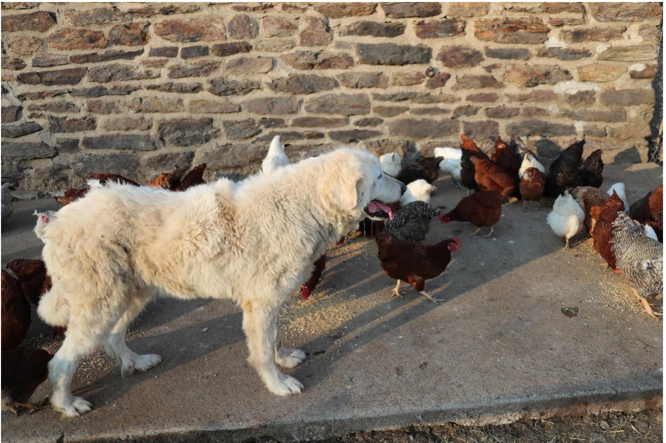
Gromit passt derweil auf die Hühner und alle anderen Tiere um das Alpgebäude auf