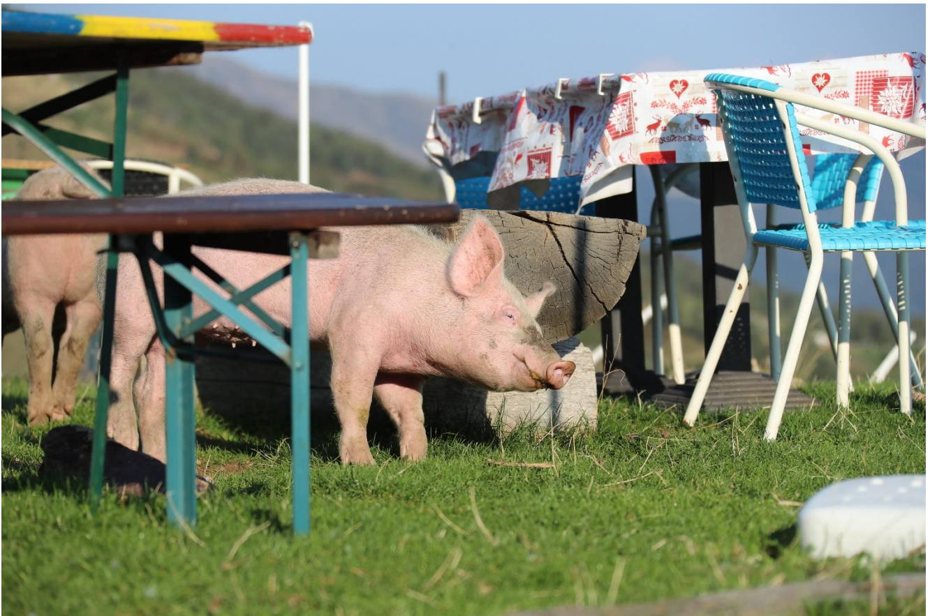
Spezielle Gäste im Gartenrestaurant