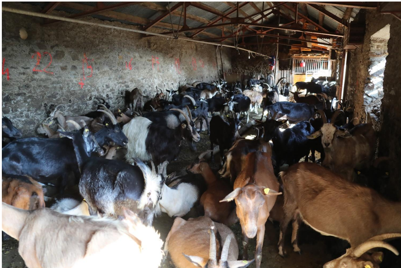
Den Tag durch schützt der Stall vor der Hitze (Alpe Rompiago)

Die Alpbewirtschafter haben mit der permanenten Behirtung und dem nächtlichen Einstallen oder dem Einsatz des Nachtpferches wiederum sehr positive Erfahrungen gemacht und möchten diese Schutzmassnahmen auch in der kommenden Alpsaison weiterführen und weiter optimieren.